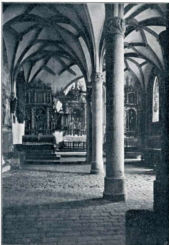
NOTRANJSČINA CERKVE SV. PRIMOŽA

Malo utrjenim potnikom ni koristno dolgo postavati na tem mestu na vetru. Umakneš se lahko k cerkovniku, ki te radovoljno pobara, ali naj ti postreže s skodelico gorkega, ali kar z latvico kislega mleka! Ne vem pa, če te tudi povpraša, si li mar hočeš ogledati cerkev. Zato mu pa reci ti sam za ključ in ne pozabi si ogledati njene zanimive notranjosti! V sedanji obliki, v gotskem slogu, je bila