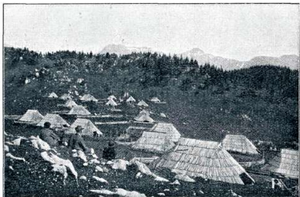
NA MALI PLANINI

Le še enkrat stopiš v redok bukov gozdič onkraj Pasje peči, kjer se prevali pot čez rob — levo na Planino, desno na Kisovec — potem pa se že viješ