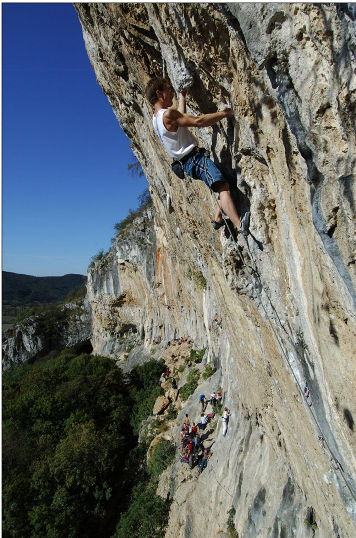
9. Johanov memorial v Črnem kalu